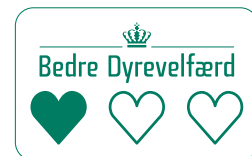
Produktlogo'er for Dyrevelfærdsmærket