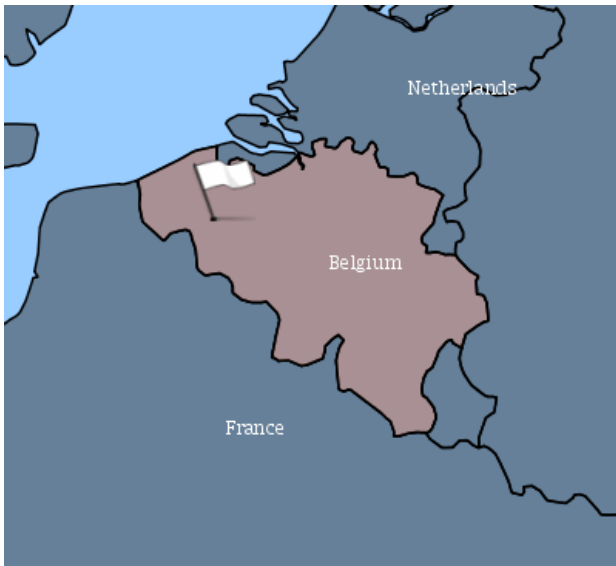
Kort over Newcastle disease udbruddet i Belgien den 17. juli 2018.