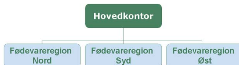
Figur 2: Fødevarestyrelsens organisation

Fødevareregionerne er selvstændige myndigheder, der varetager den direkte information og rådgivning til forbrugere, husdyrholdere, virksomheder og praktiserende dyrlæger i regionens område. Fødevareregionerne foretager kontrollen med fødevarer virksomheder og husdyrproduktion og fungerer som beredskabscentre ved udbrud af smitsomme sygdomme hos husdyr.